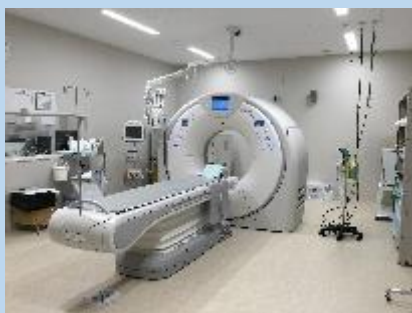
< 80列CT装置 >