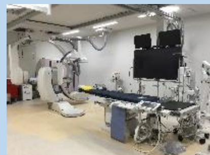
< Angio装置 >