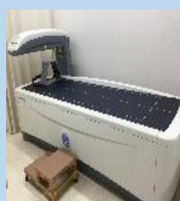
< DEXA装置 >