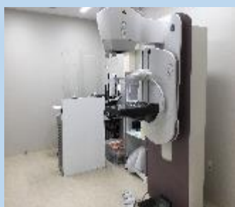
< MMG装置 >