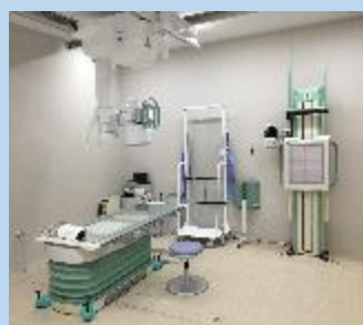
< 一般撮影装置 >