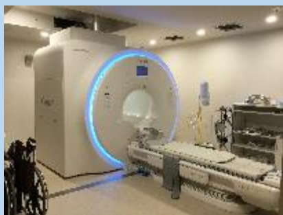
< 1.5T MRI装置 >