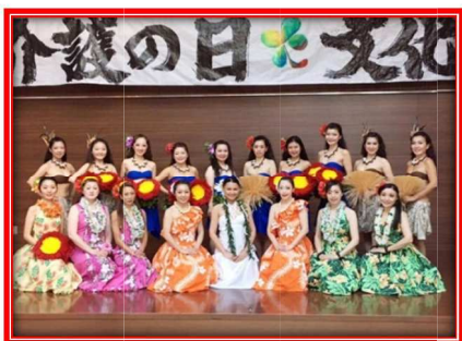
11月12日 【介護の日・文化祭】