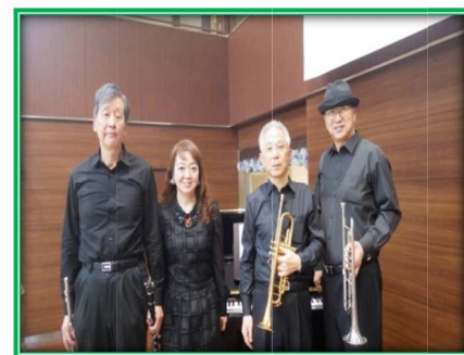
12月20日 【クリスマスコンサート】 出演：Bird Land