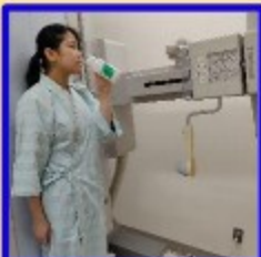
バリウムを飲むところ