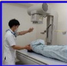
体位を変えるところ

④よく見えるタイミングの画像を 撮影していき、最後に胃を少し押 しながら詳しく観察したら終わり です④ (検査時間は10~15分ほど)