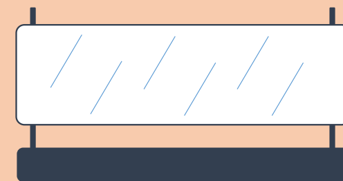
ビニール防護シートの設置