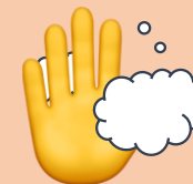
手洗い・消毒の徹底