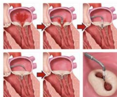
弁閉鎖不全症の心臓に対しマイトラクリップ治療を行うイメージ