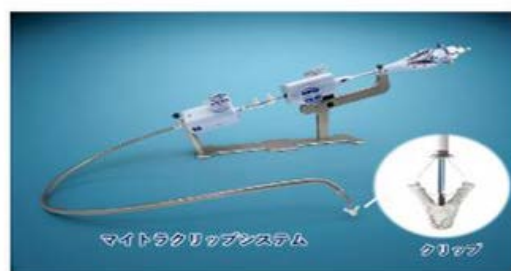
マイトラクリップシステム（器具）

イムス葛飾ハートセンターはカテーテル室に麻酔装置を設置することでマイトラクリップを行います。