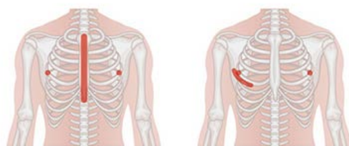
胸骨正中切開とMICSの比較

胸骨正中切開法による創部 MICSによる創部 左は従来の正中切開の創部。20cm以上あり術後の回復に時間がかかる。 右がMICSで痛みも出血も格段に少ない