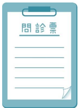
検温・問診の実施