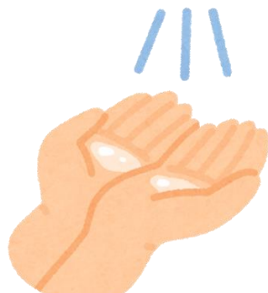
検査前後の 手指消毒の徹底