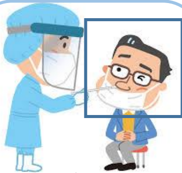
アクリルボックスによる 飛沫予防