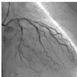
心臓の血管 (左冠状動脈)

画質の劣化を防ぐため、フルデジタル化に対応するフラットディテクタを搭載しています。