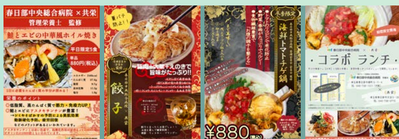
過去のコラボメニュー