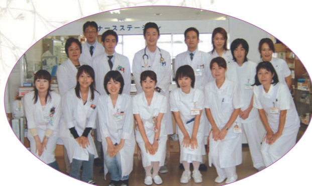
糖尿病教育入院スタッフ

これからも患者様からのご意見やご希望を伺いながら地域の方から必要としていただき、満足していただける看護が提供できますように努力していきたいと考えております。どうぞよろしくお願いたします。さらに看護部についてご質問やご意見がございましたら、いつでもご連絡ください。お待ちしております。