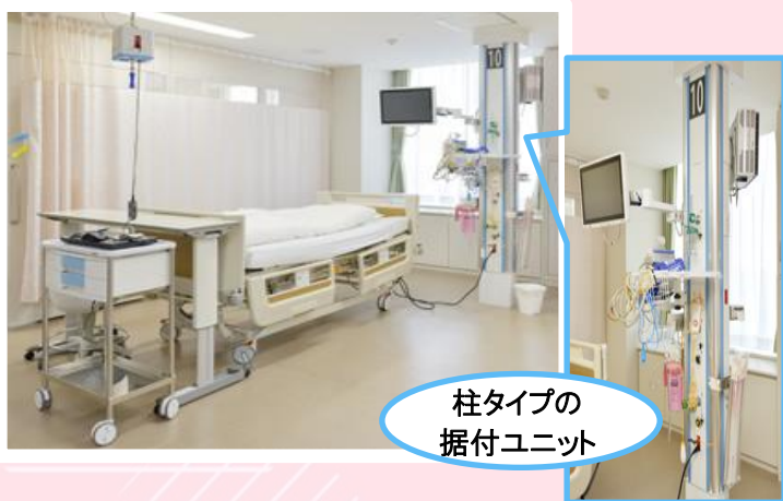
柱タイプの 据付ユニット

今までHCUは6階と8階に分かれていましたが、4階にまとめることで、重症患者様の集中管理ができるようになりました。