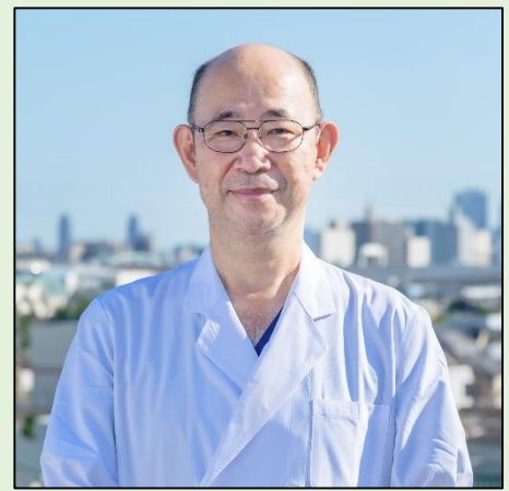
講師 新葛飾ロイヤル クリニック