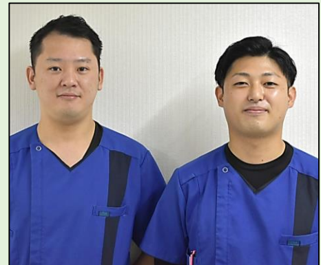
講師 イムスリハビリテーション センター東京葛飾病院