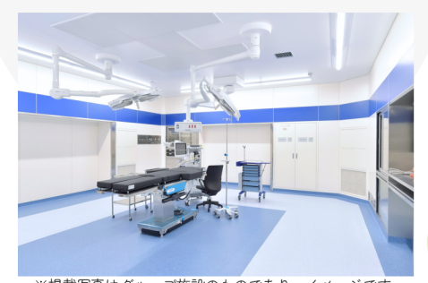
※掲載写真はグループ施設のものであり、イメージです

整形外科・形成外科を中心とした手術部門を新設。一般外傷に対応した手術を行います。