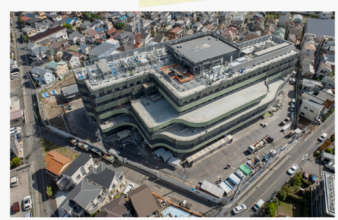
内装工事が始まりました