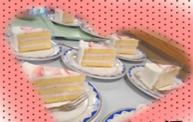
ケーキも振る舞われました