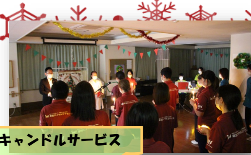
キャンドルサービス

2024年、ご利用者さまが楽しいと思える施設生活に出来るように様々なイベントを企画・運営して参りました。