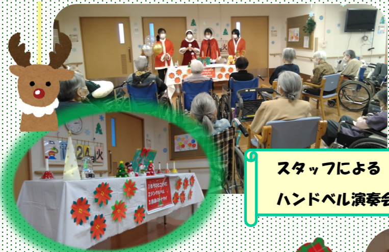
スタッフによる ハンドベル演奏会♪