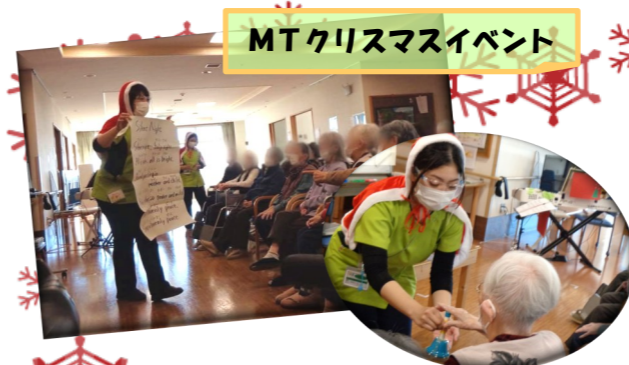
MTクリスマスイベント