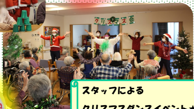
スタッフによる クリスマスダンスイベント★