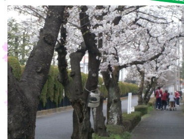
施設の前の桜並木も 綺麗でした🌸