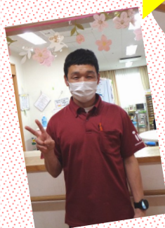
赤いTシャツと 背中のロゴが 目印です👀