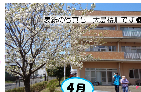
表紙の写真も『大島桜』です🌸